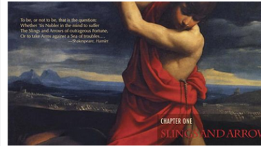
The author's enhanced e-book on King David offers features that appeal to scholars and to a general audience. Readers can click on icons to reach primary sources, maps, videos, and publishers' websites.