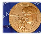
US Congressional Gold commemorating the service of Women Airforce Service Pilots (WASP). It was issued in 2009 after years of political pressure from women's organizations.

In this way, these members of society—women, ethnic minorities, gays and lesbians, and other marginalized groups—lay claim to public honors and political rights. Such battles over memory make and mold the nation's identity. Conversely, where dissent and disputation diminish, a national consciousness wanes and withers.