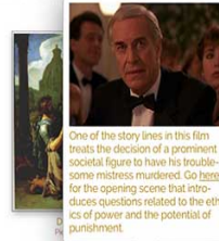
One of the story lines in this film treats the decision of a prominent societal figure to have his troublesome mistress murdered. Go here for the opening scene that introduces questions related to the ethics of power and the potential of punishment.

David thus takes the next step. The reader can sense the tragic agony of this chain of events. (One is reminded of Woody Allen's Crimes and Misdemeanors .) The king sends the soldier back to the front lines with his own death warrant in hand. Fol-